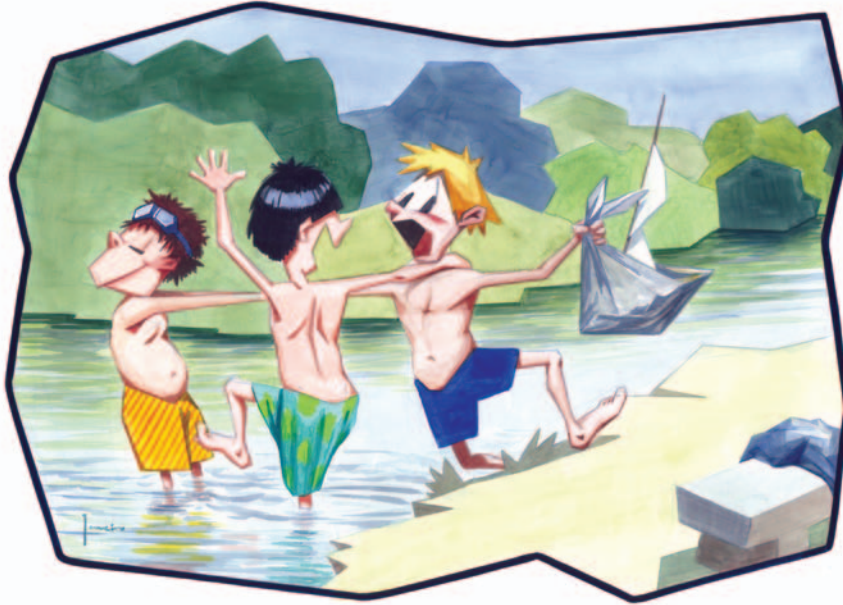
Dous nenos están a empurrar a outro á auga (Lámina 9)

Estamos nun río ou nunha praia fluvial. O importante é que dous nenos que estaban a bañarse no río están a empurrar a outro á auga. Eles pensan que o outro en realidade se achegou ao río porque quería bañarse, e por iso o empurran e o animan a meterse na auga. Nin sequera se decataron de que este leva unha bolsa na man con algo dentro que parece delicado. Deste xeito, o neno que acaba de chegar parece moi contrariado, porque nin sequera lle preguntaron que quería facer, e non era precisamente meterse na auga.