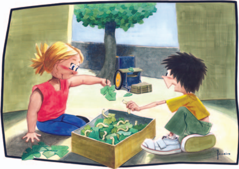
A cadeira de rodas serviulle para chegar ás follas (Lámina 12)

O neno e a nena están por fin botándolle follas de moreira aos vermes de seda. A nena baixou da cadeira de rodas e está sentada no chan, coas pernas estarricadas (nótase que non ten forza nelas, porque están simplemente deitadas no chan). Os dous aparecen divertidos e amigables, entregados con entusiasmo ao seu labor de coidadores dos vermes e esquecidos por completo da actitude distante que antes parecía separalos. Por detrás pódese ver como conseguiron alcanzar as follas, colocando a cadeira de rodas cunha táboa calquera que vai de pousabrazos a pousabrazos.